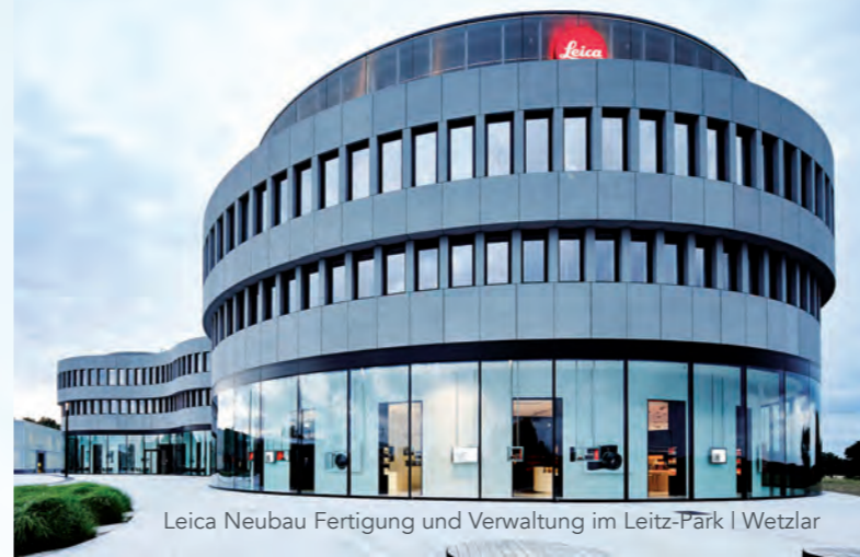
Leica Neubau Fertigung und Verwaltung im Leitz-Park | Wetzlar