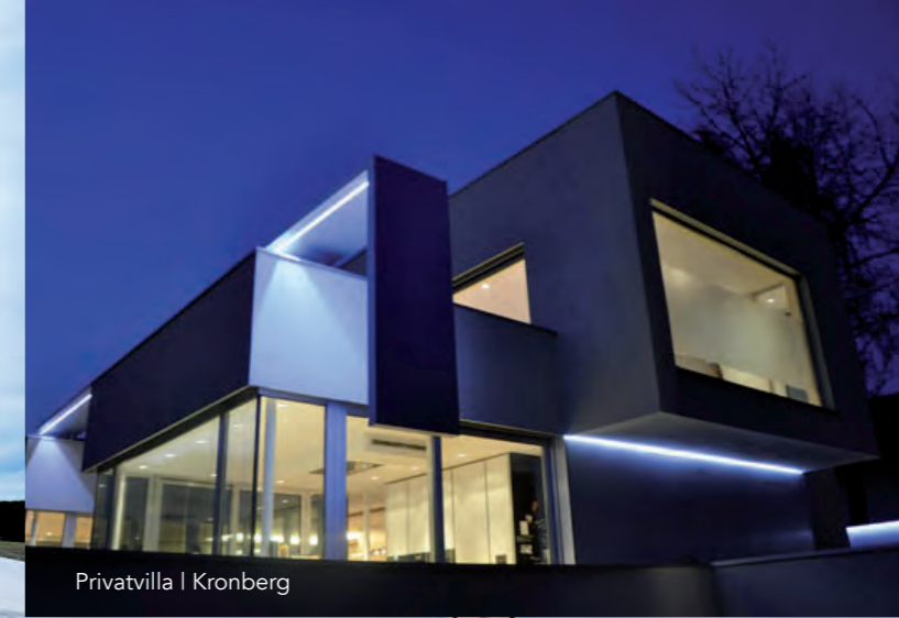
Privatvilla | Kronberg