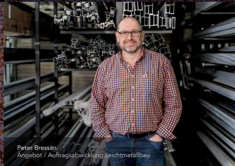
Peter Bressan Angebot / Auftragsabwicklung Leichtmetallbau