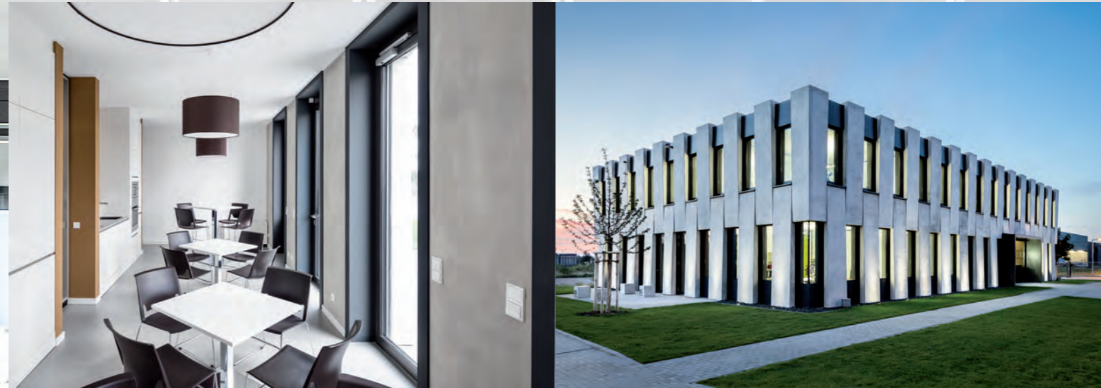
Bürogebäude innen – außen | Frankenthal

Auch bei der Montage können Sie sich auf die Expertise von Seis+Wölbert verlassen. Unsere Erfahrung reicht vom privaten Einfamilienhaus bis zum großen Gewerbeobjekt.