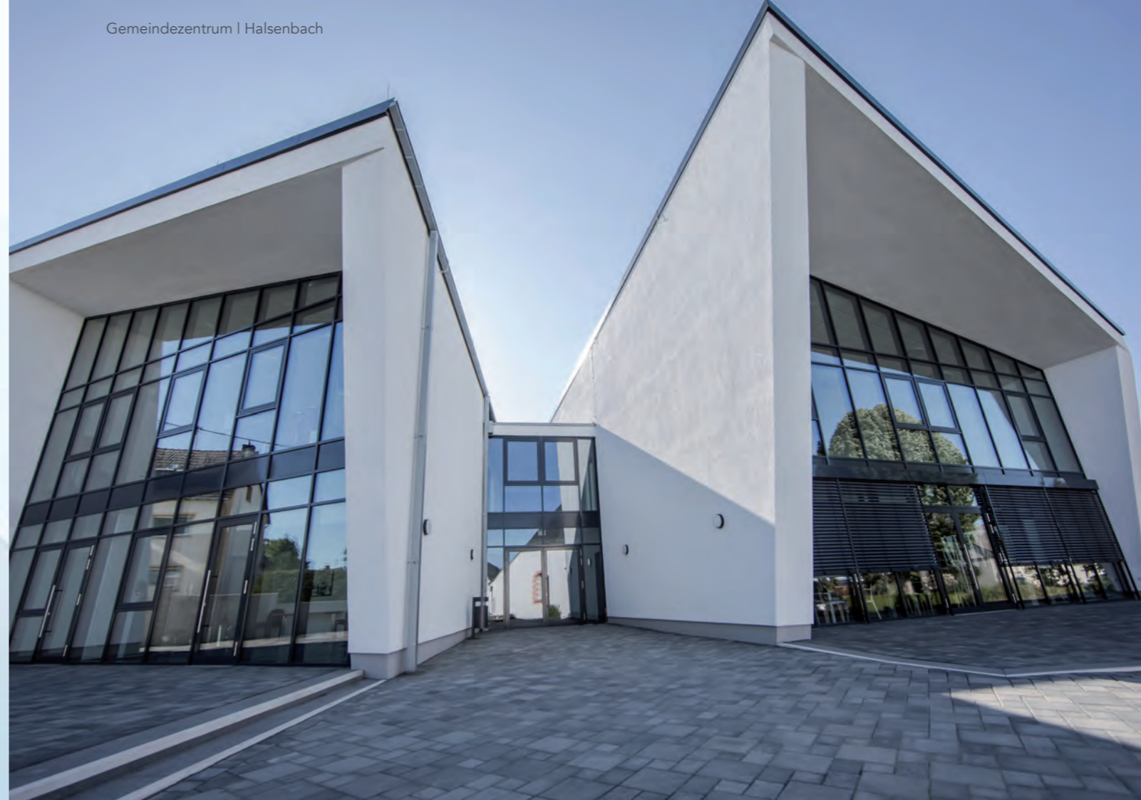
Gemeindezentrum | Halsenbach