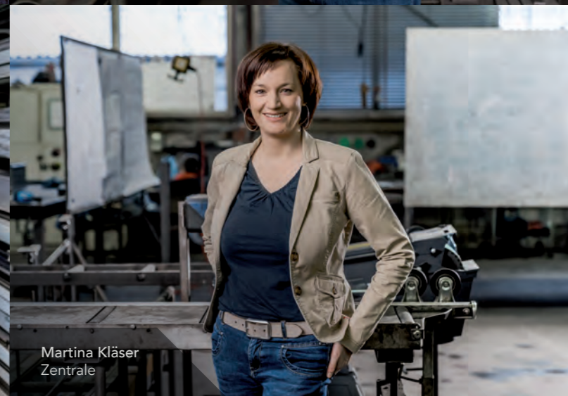
Martina Kläser Zentrale