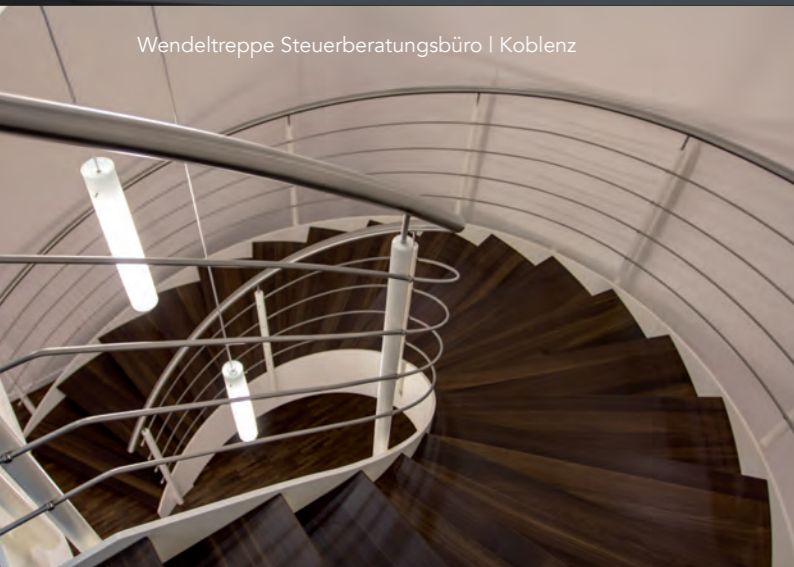
Wendeltreppe Steuerberatungsbüro | Koblenz

Geländer, Treppen und Balkone aus Meisterhand