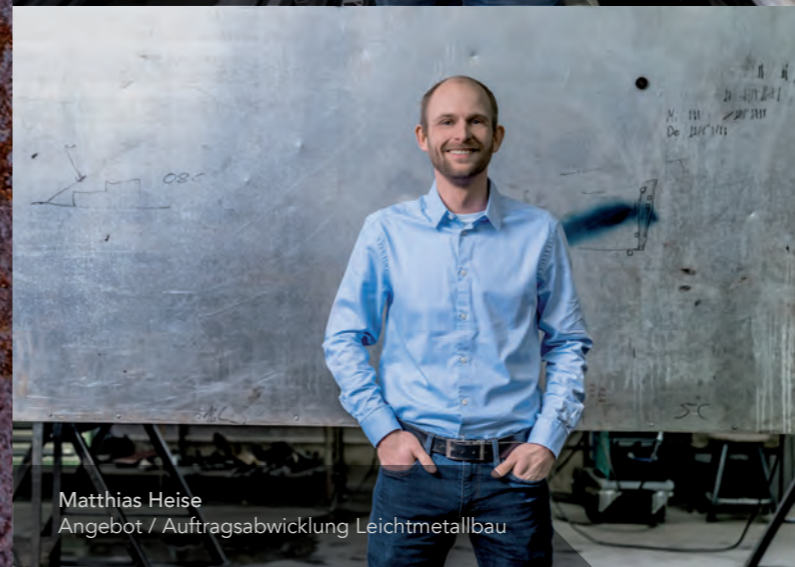
Matthias Heise Angebot / Auftragsabwicklung Leichtmetallbau