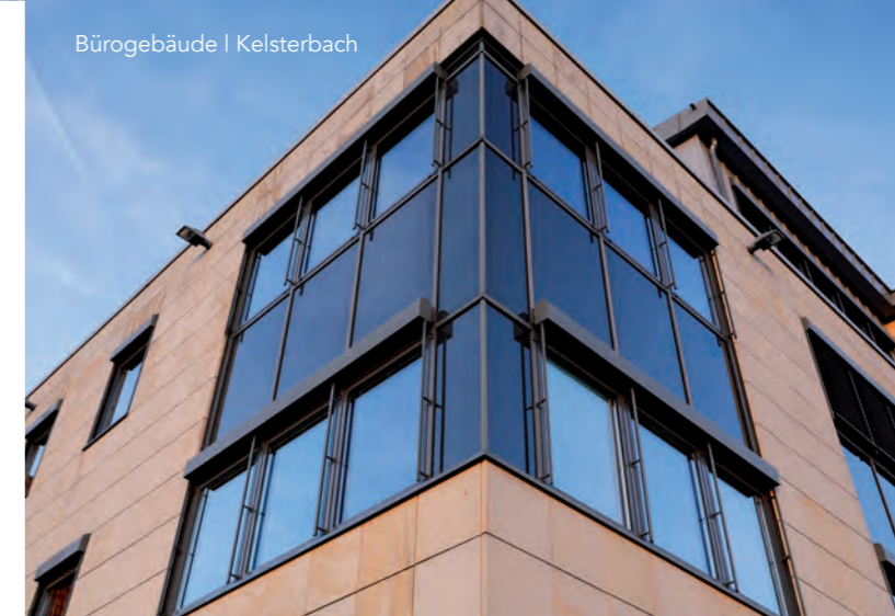
Bürogebäude | Kelsterbach

Architektur aus Glas, Stahl, Edelstahl und Aluminium