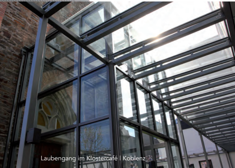
Laubengang im Klostercafé | Koblenz